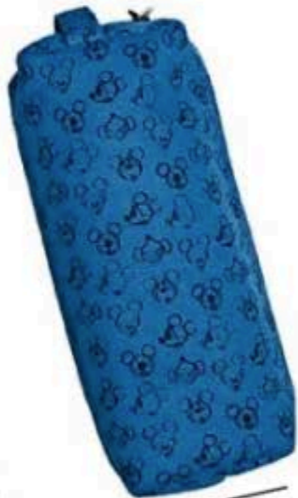
Allez, souris Trousse Mickey, Disney x Kiabi, 5 €.

Sac à dos en coton, coloris Terracotta, Moumout', 55 €.