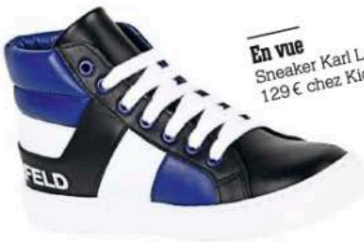
En vue Sneaker Karl Lagerfeld Kids, 129 € chez Kids Around.