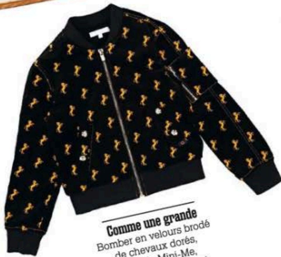
Comme une grande Bomber en velours brodé de chevaux dorés, capsule Mini-Me, du 4 au 14 ans, Chloé, à partir d'octobre.