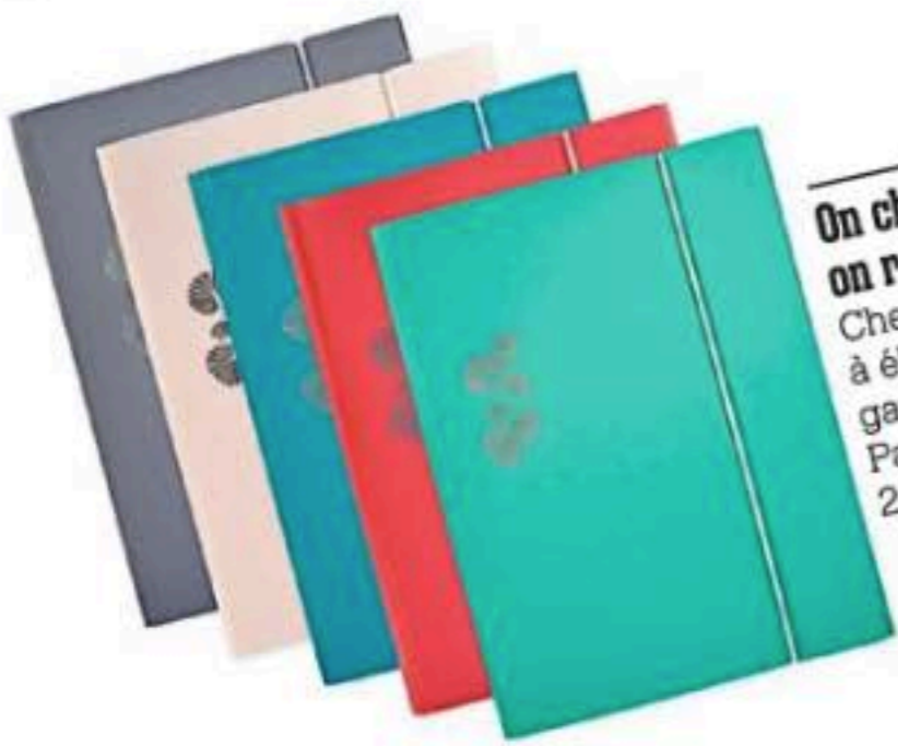
On change, on range Chemises à élastique, gamme Pastel, Elba, 2,70 € l'une.