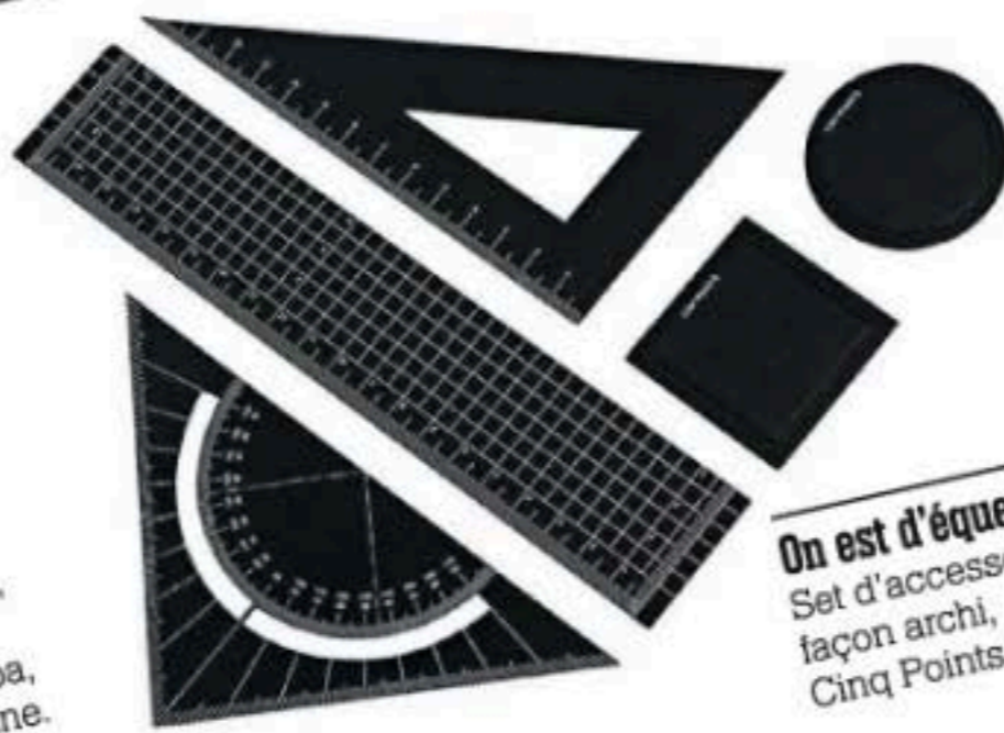
On est d'équerre Set d'accessoires façon archi, Cinq Points, 29 €.