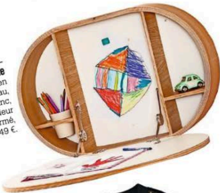
Escamotable Bureau mural BAKI en multiplis de bouleau, extérieur stratifié blanc, fond acier, profondeur 15 cm fermé, Charlie Crane, 349 €.

Blouson Sarah Jessica Parker x GapKids, 50 €.